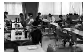
第21回全国小学生倉敷王将戦