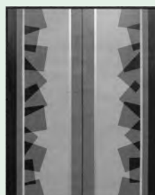
福田真 米寿展(5月) 【静かな対象形】