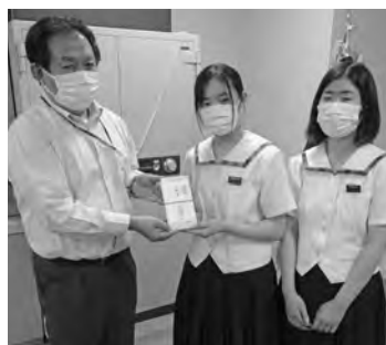
合志楓の森中学校