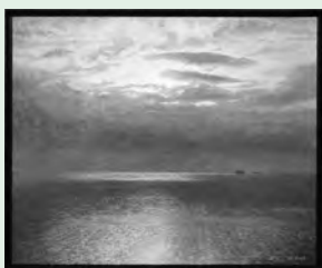
杉本一臣 個展(3月) 【角力灘】