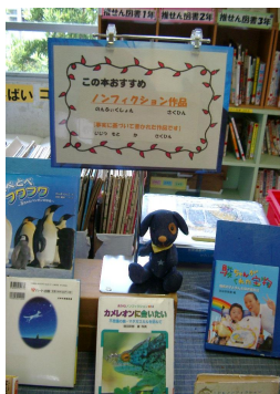
季節・行事を特集したコーナー