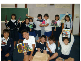
④活動を支えた委員会