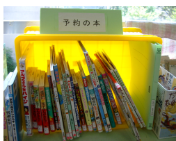
★みんなの興味のある本