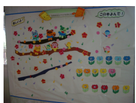
図書祭りの記念に！最後の掲示は“祝卒業・進級！”