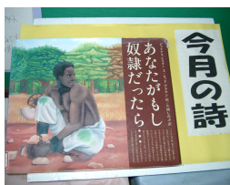
『今月の詩』を掲載した本