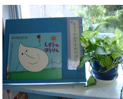
“毎日の記念日”に関連した本