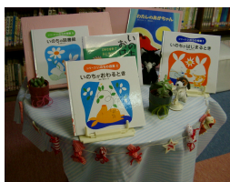
校長先生『いのち』のお話に関連した本