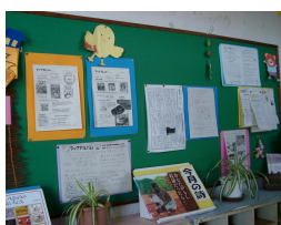
②情報発信の場としてさまざまな掲示物