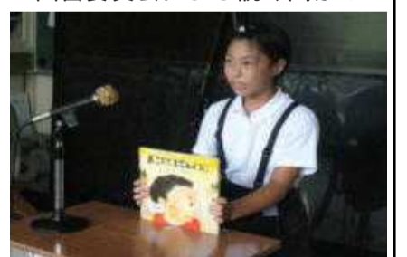
校内テレビ放送による紹介

本年度、図書委員会では、低、中、高学年ごとに、「おすすめ図書」を選定し、校内テレビ放送システムを使って全校児童に紹介しました。図書委員がそれぞれの本のおすすめの場面と感想を発信したこの取り組みは、紹介した本を中心に貸出し冊数の増加につながりました。