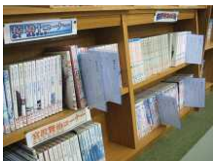
本棚に差し込まれた紹介ファイル

右に示したシートは、5年生が、授業で学習したことをきっかけに取り組みを始めた本の紹介メモです。それぞれの児童が「おもしろいな」と思った本について、右のように紹介メモに自主的に書き込み、左の写真のように、クリアファイルに入れた上で紹介した本の横に差し込んでおきます。こうすることで、他の児童が、その本を「読みたいな」と思うきっかけとなるわけです。現在、色違いのクリアファイルを用意し、他の学年へ取り組みを広げているところです。このように、授業や日常活動をきっかけにして、児童の主体的な図書館活用を促すなど、学校図書館を効果的に活用しています。