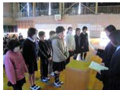
図書委員長による100冊読書表彰

図書委員会では、10月、1月、3月に100冊を超えた児童を紹介し、図書委員長より表彰を行っています。右の写真は、1月の表彰の様子です。この時に100冊を超えた児童は18名でした。3月には40名になったことから、児童の読書意欲の高さが継続していたことがうかがえます。