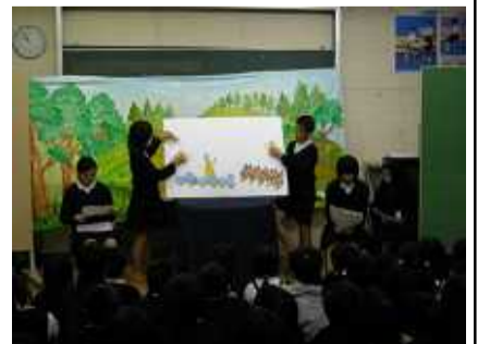
図書委員会初のパネルシアター

図書委員会では、本年度の目標に向けて、全校児童にもっと読書に親んでもらおうと、本校初となる、図書委員会によるパネルシアターを児童が自主的に計画し、2月について実施にこぎつけました。BSDのパネルシアターを参考に、「ぞうのたまごのたまごやき」を行い、全校児童に楽しんでもらいました。