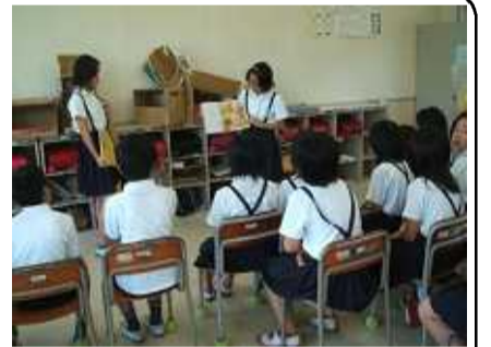
図書委員会による読み聞かせ

本年度は、本校図書委員会の児童が、BSDのみなさんによる木曜朝の読み聞かせの際、BSDメンバーが来られない学級に対して、自主的に読み聞かせ活動を行っています。聞く児童はもとより、読み聞かせを行う図書委員会の児童にとっても、楽しい時間になっています。