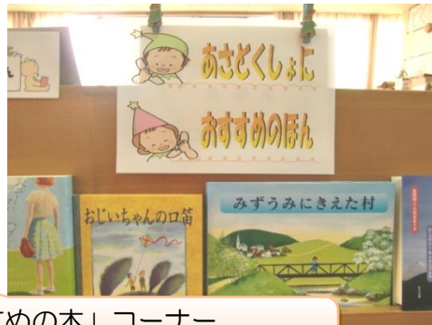
「朝読書にオススメの本」コーナー 低学年・高学年向けに分けています

新刊図書のコーナーを設置し、新しい本への出会いを魅力あるものになっている。また、熊本県教育会館より寄贈していただいた図書協力費で今年度も「朝読書にオススメの本シリーズ」を購入し専用コーナーを充実させた。新刊図書がでると、常に貸し出しの状態となり、子どもたちは意欲的に読書活動に親しんでいる。