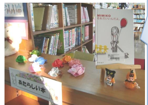
新刊図書の紹介コーナー