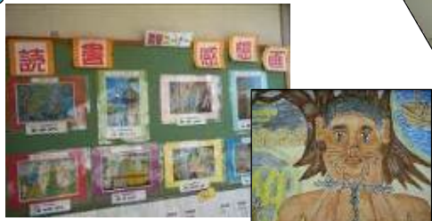
西日本読書感想画コンクール入選作品